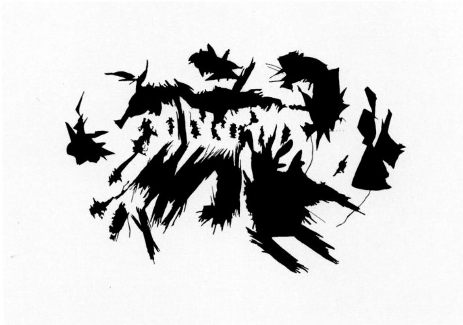
Anthony Braxton's Tri-Centric Orchestra, performing Composition 102, The Knitting factory, New York City, USA, malba na zdi / New York, 1998, 300 x 500 cm